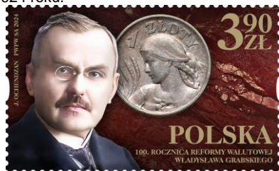
100. ROCZNICA REFORMY WALUTOWEJ WŁADYSŁAWA GRABSKIEGO 30.01.2024 WARSZAWA 1

30 stycznia 2024 roku do obiegu wchodzi znaczek pocztowy o wartości 3,90 zł, na którym przedstawiono popiersie Władysława Grabskiego i awers monety o nominale 1 złoty wprowadzonej reformą walutową w 1924 roku.