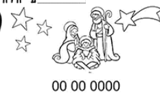
Boże Narodzenie Poznań 9