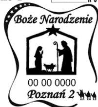
Boże Narodzenie Poznań 2