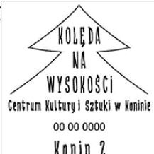
Kolęda na Wysokości Konin 2