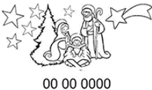
Boże Narodzenie Gniezno 1