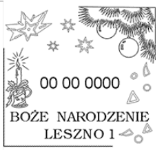
BOŻE NARODZENIE LESZNO 1