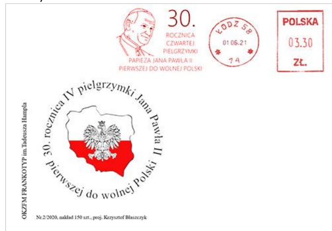
Przewodniczący klubu Krzysztof Błaszczyk

Należność za ofrankowanie korespondencji należy wpłacić na konto Okręgu Łódzkiego PZF z dopiskiem Klub Frankotyp, nr konta: PKO BP o/Łódź 45 1020 3352 0000 1502 0092 1791. Do przesyłki proszę dołączyć kopię dokonania wpłaty, ofrankowane zostaną wszystkie koperty nadesłane do 26.05.2021 r. Ze względu na brak możliwości śledzenia wpłat na koncie bankowym Zarządu Okręgu Łódzkiego na bieżąco, poza wpłatą na konto konieczne należy złożyć zamówienie listownie lub mailem na adres blaszczyk26@interia.pl. Wszystkie zamówienia i nadesłane przesyłki po tym terminie będą mogły być zrealizowane ale tylko pod warunkiem opłacenia kosztów przesyłki zwrotnej.