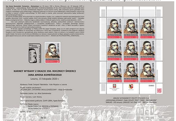
Lech Woźny, Prezes Koła PZF w Lesznie

W dniu 15 listopada 2020 r. (niedziela) datownik będzie stosowany w Urzędzie Pocztowym Leszno 1 w godz. 11.00 - 13.00 Zapraszamy wszystkich zainteresowanych historią Leszna, nie tylko filatelistów.