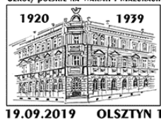
Szkoły polskie na Warmii i Mazurach