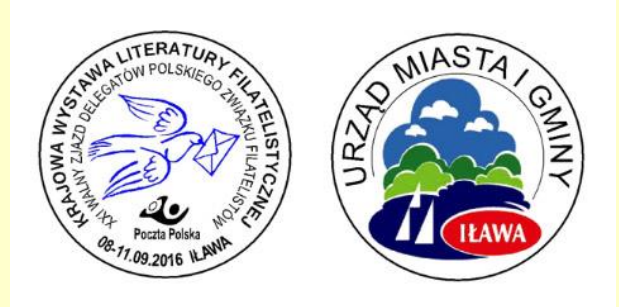
Projekt medalu wystawowego

W tym miejscu chciałbym gorąco podziękować Członkom Sądu Konkursowego za przychylne oceny i przyznane wyróżnienia.