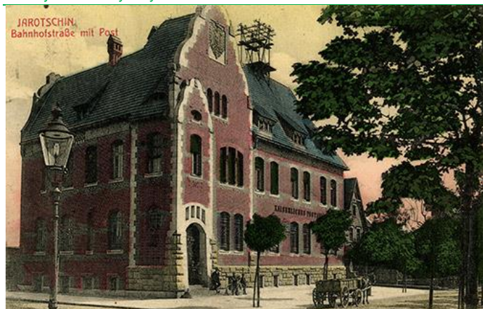
Na trzeciej (il.3) pocztówce, ręcznie kolorowanej, utrwalono widok obecnej siedziby poczty w Jarocinie. Wykorzystana fotografia została wykonana od strony magistratu i pochodzi z około 1906 roku. Przedstawia nową lokalizację miejscowej poczty, przy Bahnhofstraße obecnie Al. Niepodległości