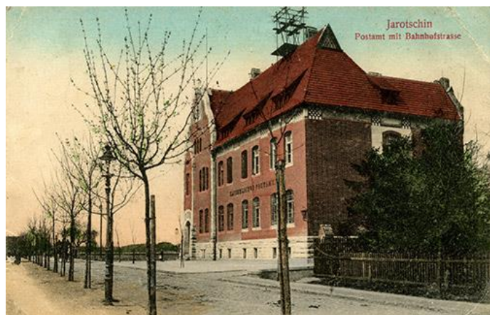
Ostatnia kartka widokowa (il.4) przedstawia ten sam obiekt co na il. 3, tym razem zdjęcie zostało wykonane od strony rynku i przedstawia perspektywę ulicy Bahnhofstrasse (Al. Niepodległości) w kierunku dworca kolejowego. Pocztówka z początku XX wieku