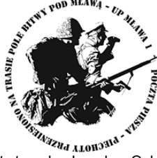
Projekt stempla: Jarosław Ochendzan