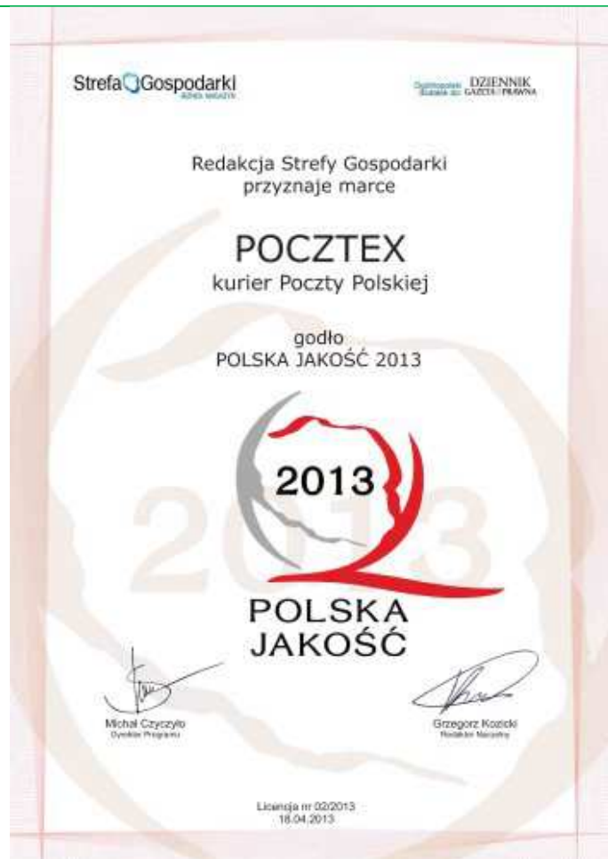
Informacja prasowa Poczty Polskiej SA

W 2012 roku Pocztex dostarczył blisko 7 proc. więcej przesyłek niż rok wcześniej. Pierwszy kwartał 2013 to już wzrost sprzedaży usług kurierskich o 70 proc. w porównaniu do I kwartału 2012 r.