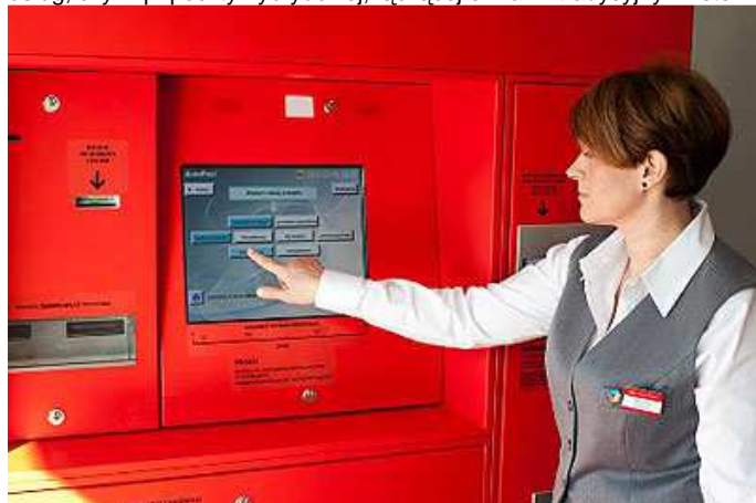
Informacja prasowa Poczty Polskiej SA

Poczta Polska stawia na poprawę jakości obsługi klientów - to jeden z najważniejszych elementów strategii PP. Spółka już dziś w istotny sposób przyspieszyła doręczanie przesyłek i bezpieczeństwo obrotu pocztowego. Firma uprościła ofertę i wdrożyła szereg produktów m.in. na rynku paczkowym. Już dziś klienci mogą korzystać z pierwszych e-usług, czyli np. poczty hybrydowej, łączącej e-mail z tradycyjnym listem.