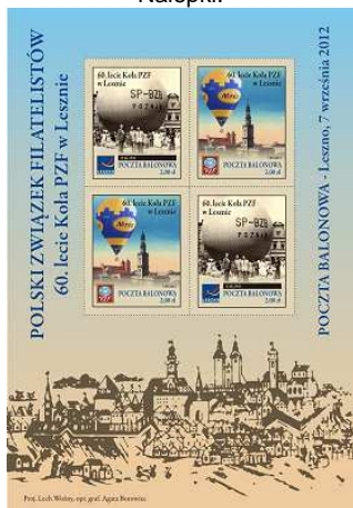
Koło Miejskie PZF w Lesznie