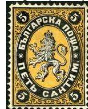
Pierwszy znaczek bułgarski

W okresie od 27 do 31 maj 2009r. w bardzo obszernych salach na różnych kondygnacjach Narodowego Pałacu Kultury w Sofii, na powierzchni 3000 m2 wystawa pomieściła ponad 1100 ekranów. Otwarcia EWF "Bułgaria 2009" dokonał Prezydent Bułgarii - Pan Georgi Parvanov. Z jedenastu zgłoszonych eksponatów z Polski przyjęto tylko sześć, zaś pięć oceniono.