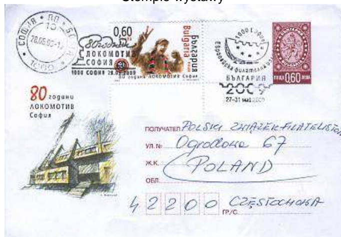
Pamiątka z imprez towarzyszących - 80 lat klubu piłkarskiego "Lokomotiv Sofia"