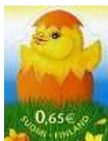
Tegoroczny fiński znaczek wielkanocny

Zdrowych, Wesółych, Pogodnych i Radosnych Świąt Wielkiej Nocy