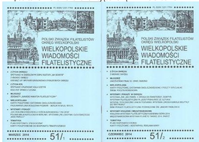
Nadesłał: Ludwik K. Malendowicz

Redakcja: Marek Jedziniak, Wydawca: Marek Jedziniak, email: kzp@kzp.pl. Pismo bezpłatne, ukazuje się wyłącznie w formie elektronicznej. Archiwalne numery do pobrania na stronie internetowej „Katalog Znaków Pocztowych” www.kzp.pl/buletyn .